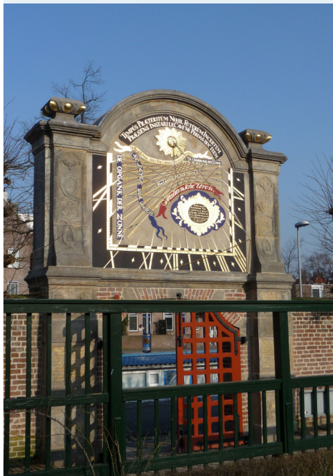
De zonnwijzer op de tuinpoort van het Prinsenhof te Groningen is een van de mooiste van ons land.

De Zonnwijzerkring Secretariaat: Toutenburglaan 13 9861 DB Grootegast info@zonnwijzerkring.nl Bankrekening: NL02 INGB 0000 5188 37 t.n.v. De Zonnwijzerkring