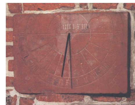
De oudste zonnewijzer in Nederland is te vinden op de Jacobikerk in Utrecht.

Zonnewijzers worden vaak beschouwd als "oude spullen, die toch niet goed werken". Maar niets is minder waar! De zonnewijzerkunde maakt de laatste decennia een sterke ontwikkeling door. Nieuwe inzichten leiden tot nieuwe typen zonnewijzers met soms onverwachte eigenschappen. Het gebruik van computers heeft nieuwe mogelijkheden van ontwerp en constructie geschapen. Nederlandse gnomonici hebben hierin een aanzienlijk aandeel gehad.