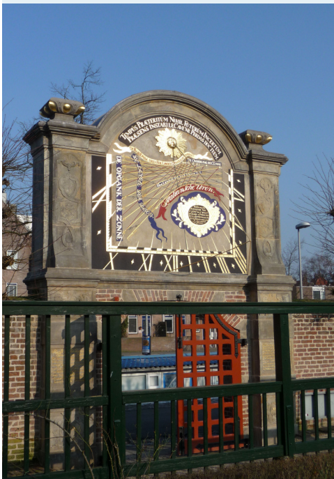
De zonnwijzer op de tuinpoort van het Prinsenhof te Groningen is een van de mooiste van ons land.

De Zonnwijzerkring Secretariaat: Molukkenstraat 3d 6524 NA Nijmegen info@zonnwijzerkring.nl Bankrekening: NL02 INGB 0000 5188 37 t.n.v. De Zonnwijzerkring